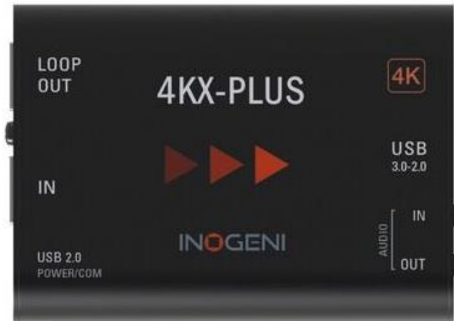
Abb.1: Inogeni USB Grabber Übersicht