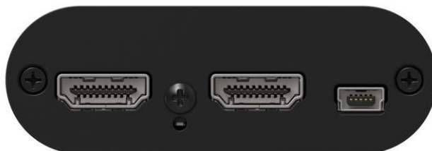
Abb.3: Inogeni USB Grabber Seitenansicht HDMI Ausgang (links), HDMI Eingang (Mitte) sowie USB Anschluss für die Stromversorgung (rechts).