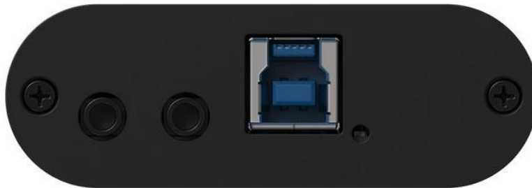
Abb.2: Inogeni USB Grabber Seitenansicht: Audio Ausgang 3,5mm Klinke (links), Audio Eingang 3,5mm Klinke (Mitte) und USB Anschluss (rechts).